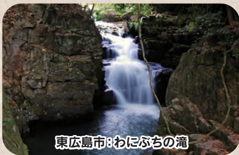
東広島市: わにぶちの滝