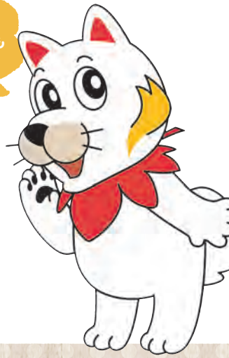
広島広域都市圏マスコットキャラクター ひろしま都市犬はっしー