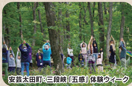
安芸太田町: 三段峡「五感」体験ウィーク

新型コロナウイルス感染症の 影響により、掲載のイベントが 中止・延期・変更となる場合が あります。問い合わせ先にご確 認のうえ、お出かけください。