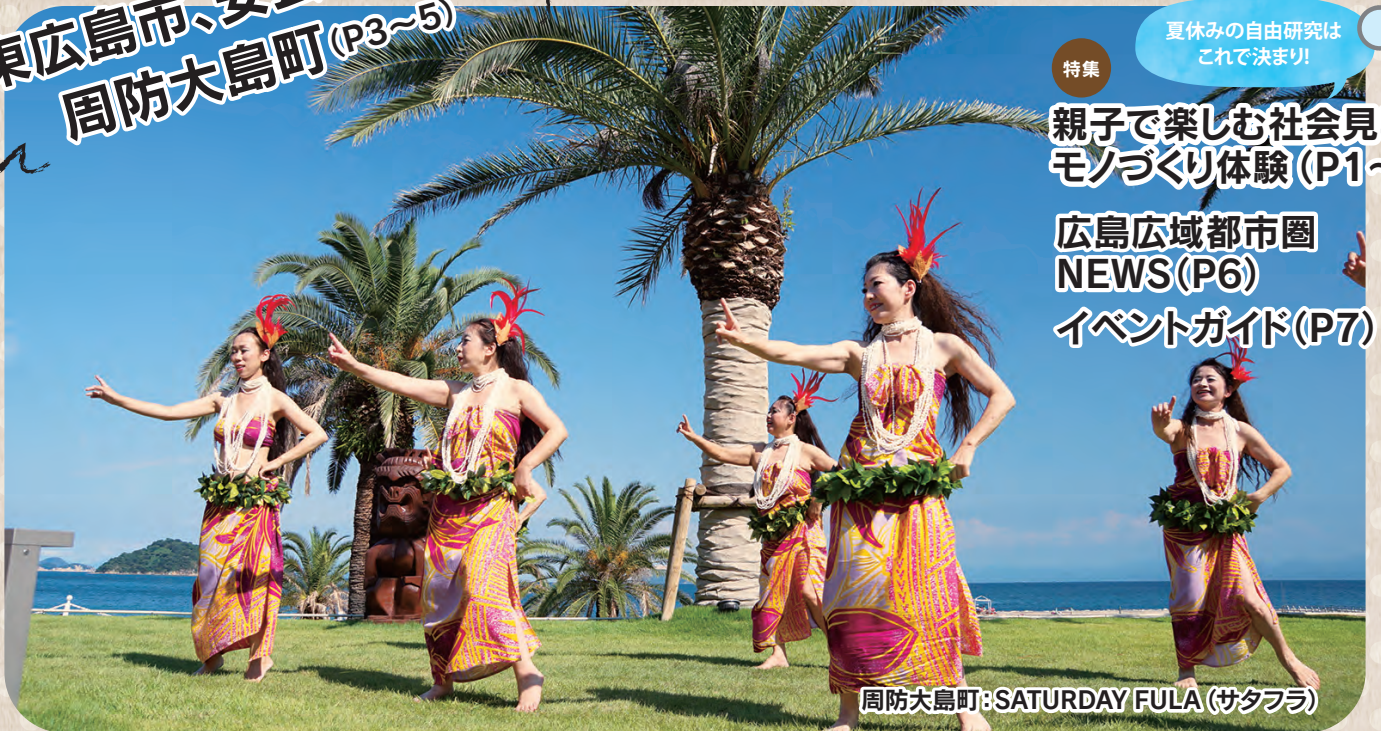
周防大島町: SATURDAY FULA (サタフラ)